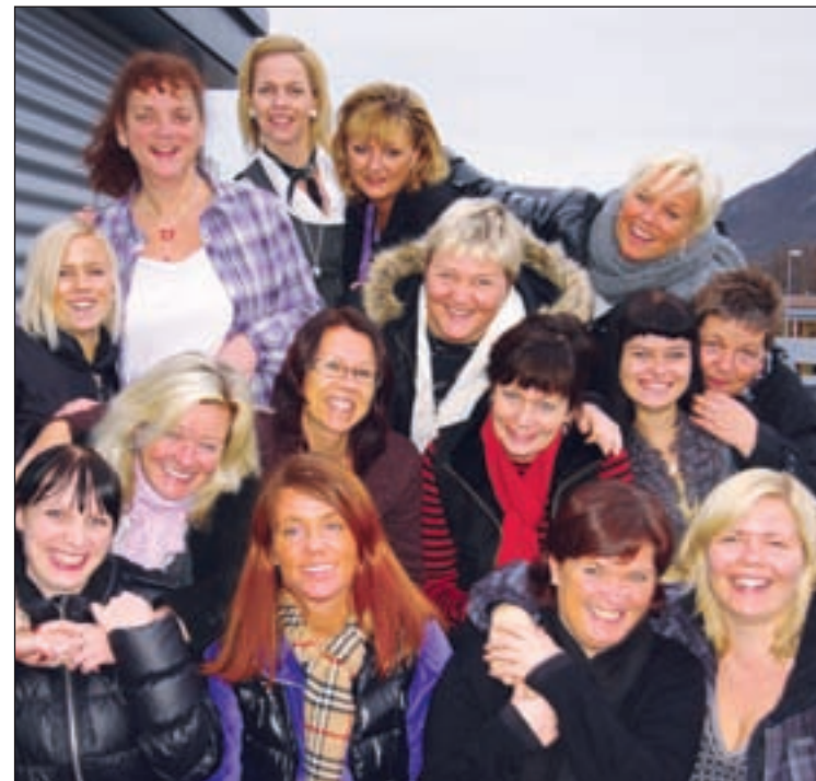
Et utvalg ansatte fra Kaefer i Stavanger som jobber med iCore systemet. Det ser ut som de trives med oppgavene.

Resultatet har blitt et standardisert modulbasert produkt som kan kjøpes og tilpasses bruken hos de mest krevende kundene. Alle brukere jobber i gjenkjennbare WEB grensesnitt, uansett oppgave. Et tjuetalls bedrifter benytter så langt iCORE, et system som kjennetegnes av stor fleksibilitet, knirkefri drift og kraftige vel-fungerende verktøy for integrasjon med andre datasystemer. iCORE er faktisk problemfritt. Det bekrefter IT fol-